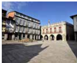
8 ANTIGOS PAÇOS DO CONCELHO

Segundo a tradição, uma imagem da Virgem Santa Maria, trazida pelo apóstolo S. Tiago, foi colocada num largo. É por esse motivo que esta praça bastante antiga, que conserva ainda a sua traça medieval, se chama Praça de S. Tiago. No séc. XI, os Francos que acompanharam o Conde D. Henrique fundam aí uma capela dedicada ao santo. No séc. XVII, o templo é demolido e substituído por um outro, do qual também não sobram vestígios. Mais tarde, para recordar estas pré-existências, é gravada no pavimento uma vieira — lembrando S. Tiago — e as primeiras palavras latinas da Carta de Foral, concedida pelo Conde D. Henrique aos homens de Guimarães: “A vós homens que viestes povoar Guimarães e áqueles que aqui queiram habitar...”. [“Ad vos homines qui venistis populare in Vimarenens et ad illos qui ibi habitare voluerint...”].