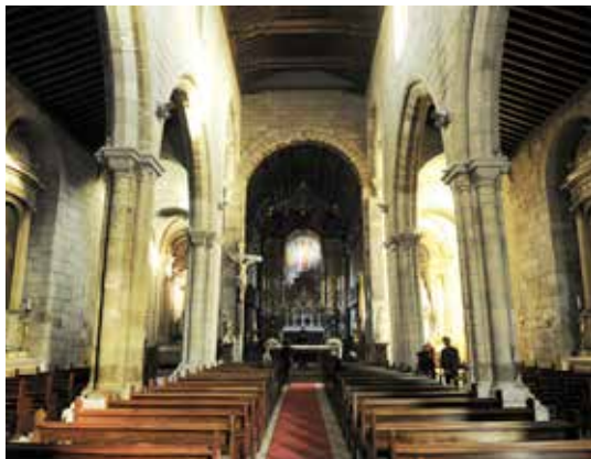
10 IGREJA DA NOSSA SENHORA DA OLIVEIRA MONUMENTO NACIONAL

As origens da Igreja de Nossa Senhora da Oliveira remontam aos tempos da Condessa Mumadona Dias e à fundação da cidade de Guimarães. O mosteiro em honra do Salvador do Mundo, da Virgem Santa Maria e dos Santos Apóstolos que a Condessa Mumadona manda construir no séc. X, dá origem, no séc. XII, a uma colegiada. Durante a idade Média, a Igreja de Nossa Senhora da Oliveira transforma-se num popular centro religioso da Península Ibérica, fruto da popularidade juntos dos peregrinos a Santiago de Compostela. Aquando a instauração da república, em 1911, a colegiada extingue-se. O edifício vai sofrendo, ao longo dos tempos, sucessivas reconstruções, motivo pelo qual apresenta características de diferentes épocas e estilos. A última intervenção, que data de 1967, restitui-lhe grande parte da influência gótica que ainda hoje mantém, depois de, em 1830, ter sido alvo de uma reforma neoclássica. A Igreja de Nossa Senhora da Oliveira é, sem dúvida, um dos monumentos vimaranenses de maior relevo histórico.