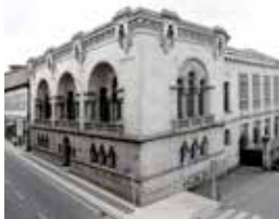
17 MUSEU ARQUEOLÓGICO DA SOCIEDADE MARTINS SARMENTO

A Sociedade Martins Sarmiento é uma instituição cultural de natureza privada, sem fins lucrativos, que foi fundada em 1881 em homenagem ao arqueólogo vimaranense Francisco Martins Sarmiento. A sua sede é um imponente edifício, em estilo neoclássico, projetado pelo arquiteto Marques da Silva, onde estão instalados o mais antigo Museu Arqueológico português e uma magnífica Biblioteca Pública dotada de uma notável secção de livros acerca de Guimarães. O Museu Arqueológico da Sociedade Martins Sarmiento, um dos espaços de referência da história da arqueologia em Portugal, foi fundado em 1885, e do seu acervo destacam-se materiais castrejos e romanos, fruto de escavações realizadas na região, especialmente das que tiveram lugar na Citânia de Briteiros. Desde 1888 que está instalado no