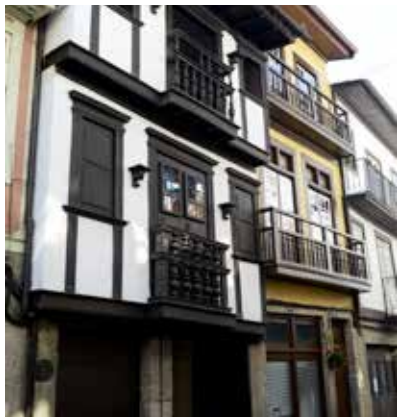
13 CASA DA RUA NOVA

Sabe-se que a Casa da Rua Nova, no número 115 da Rua Egas Moniz, tem origem remota, ainda que não seja possível precisar com exatidão a data da sua construção. O projeto de restauro desta casa, da autoria do arquiteto Fernando Távora, recebeu o Prémio Europa Nostra, em 1985. A obra teve um carácter exemplar, constituindo-se num ato pedagógico e num incentivo para as recuperações que foram acontecendo ao longo de vários anos no centro histórico da cidade, o que lhe valeu, em 2001, a classificação pela UNESCO de Património Cultural da Humanidade. O critério utilizado na recuperação foi o de consolidar a sua estrutura, sem alterar a sua organização interna. Para o efeito, utilizou-se mão de obra local e materiais e técnicas tradicionais, de modo a obter as unidades construtiva, formal e ambiental.