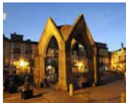
11 PADRÃO DO SALADO MONUMENTO NACIONAL