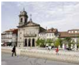
16 IGREJA S. PEDRO

A Igreja de S. Pedro foi a primeira igreja na Arquidiocese de Braga a receber o título de basílica, graças ao indulto concedido pelo Breve de Benedito XIV em 1751. A igreja, de formas simples, que acolhe a imagem do padroeiro, começou a ser construída em 1737 e posteriormente benzida, em 1750. Em 1881, reiniciam-se as obras com a demolição das estruturas provisórias e das casas em frente ao corpo da igreja. Os trabalhos terminariam nos inícios do séc. XX, sendo apenas construída uma das duas torres previstas. A igreja, de planta longitudinal, possui capela-mor e nave única retangulares. A capela-mor é separada da nave por arco de cruzeiro de volta perfeita e nela se destaca um retábulo de talha azul e dourada.