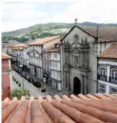
14 IGREJA DA MISERICÓRDIA

Sabe-se que a Casa da Rua Nova, no número 115 da Rua Egas Moniz, tem origem remota, ainda que não seja possível precisar com exatidão a data da sua construção. O projeto de restauro desta casa, da autoria do arquiteto Fernando Távora, recebeu o Prémio Europa Nostra, em 1985. A obra teve um carácter exemplar, constituindo-se num ato pedagógico e num incentivo para as recuperações que foram acontecendo ao longo de vários anos no centro histórico da cidade, o que lhe valeu, em 2001, a classificação pela UNESCO de Património Cultural da Humanidade. O critério utilizado na recuperação foi o de consolidar a sua estrutura, sem alterar a sua organização interna. Para o efeito, utilizou-se mão de obra local e materiais e técnicas tradicionais, de modo a obter as unidades construtiva, formal e ambiental.