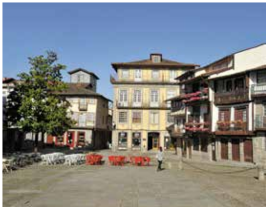
7 PRAÇA S. TIAGO

Segundo a tradição, uma imagem da Virgem Santa Maria, trazida pelo apóstolo S. Tiago, foi colocada num largo. É por esse motivo que esta praça bastante antiga, que conserva ainda a sua traça medieval, se chama Praça de S. Tiago. No séc. XI, os Francos que acompanharam o Conde D. Henrique fundam aí uma capela dedicada ao santo. No séc. XVII, o templo é demolido e substituído por um outro, do qual também não sobram vestígios. Mais tarde, para recordar estas pré-existências, é gravada no pavimento uma vieira — lembrando S. Tiago — e as primeiras palavras latinas da Carta de Foral, concedida pelo Conde D. Henrique aos homens de Guimarães: “A vós homens que viestes povoar Guimarães e áqueles que aqui queiram habitar...”. [“Ad vos homines qui venistis populare in Vimarenens et ad illos qui ibi habitare voluerint...”].