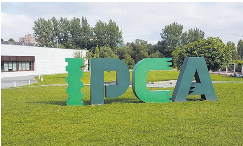
Instituto Politécnico do Cávado e do Ave em Barcelos

Em Março de 2002 tiveram início as obras da primeira fase do