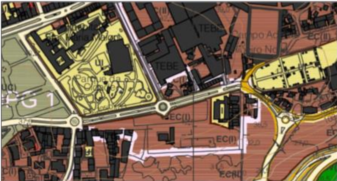
Extrato da Planta de Ordenamento do PDM de Barcelos. Na planta de Ordenamento do PDM de Barcelos o terreno encontra-se classificado como “Solo Urbanizado – Espaço Central – Espaço Central (Nível I)”.